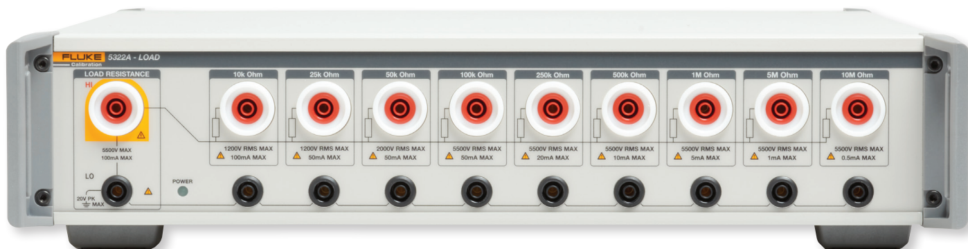
Option de charge haute résistance 5322A-LOAD facultative