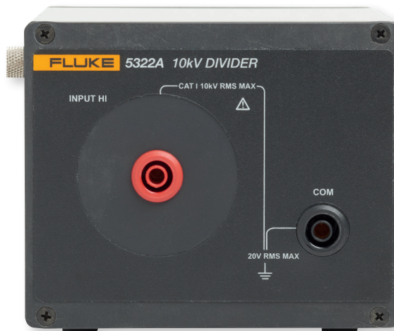
Le 5322A comprend un diviseur externe de 10 kV pour mesurer les testeurs avec sorties de 10 kV.

Ce large éventail d'options de modèles vous permet de sélectionner le modèle adapté à votre charge de travail et votre budget.